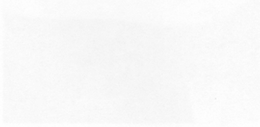
CORTIÁ. Los jurados que eligen los mejores vinos de Málaga se reúnen en el Hotel Cortiá.

La mejor nota la obtiene Café de París, con un 8,75, mientras que logran un 8,50 Alborque, la Bodega de Hostipaña y Cónsul, Calina (Marbella), La Nativac (Mijas), Santagón (Marbella), Taberna del Albarque.